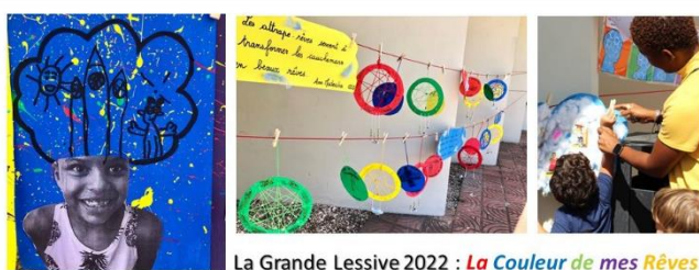
La Grande Lessive 2022 : La Couleur de mes Rêves